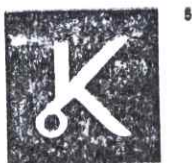
K TEKSTIL d.o.o. Svilarska 2, Varaždin