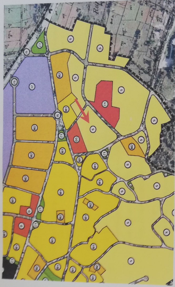
Neposredno susjedstvo predmetne nekretnine u UPU Naselja Rovinjsko selo - korištenje i namjena površina