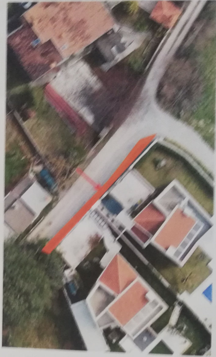
POLOŽAJ POCETNEJ VEŠETNINE