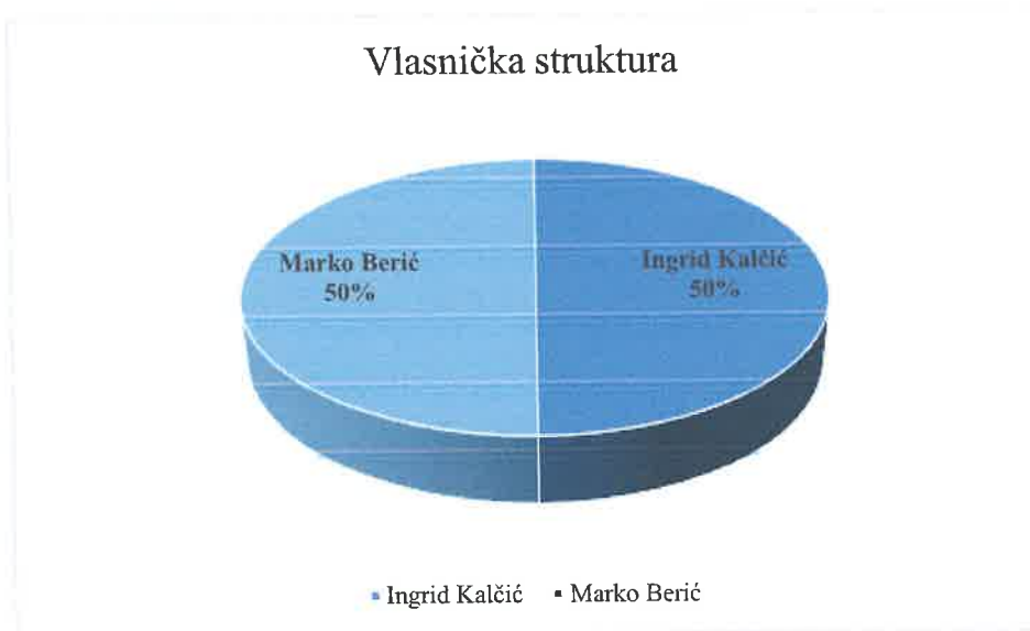
Grafički prikaz vlasničke strukture