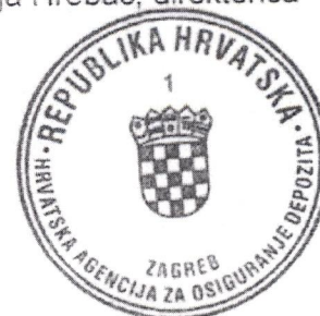
Marija Hrebac, direktorica

Kako su troškovi iskazani u predračunu likvidacijskog postupka osnovani i obrazloženi, te se prema dostavljenim podacima likvidatora očekuje namirenje iz potraživanja kupaca iskazanih u bilanci dužnika, to je u cilju provođenja postupka prisilne likvidacije nad dužnikom Internet mobile bank d.d. u likvidaciji odlučeno kao u dispozitivu odluke.