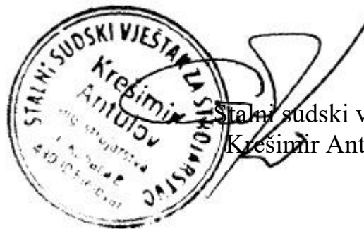
Stalni sudski vještak Krešimir Antulov

Procijenjene pokretnine, imaju utvrđenu tržišnu vrijednost u stanju i na lokaciji gdje je pregled izvršen.