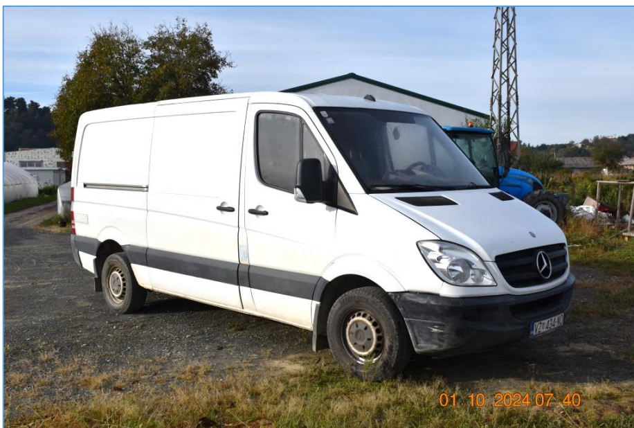
Vanjski izgled vozila