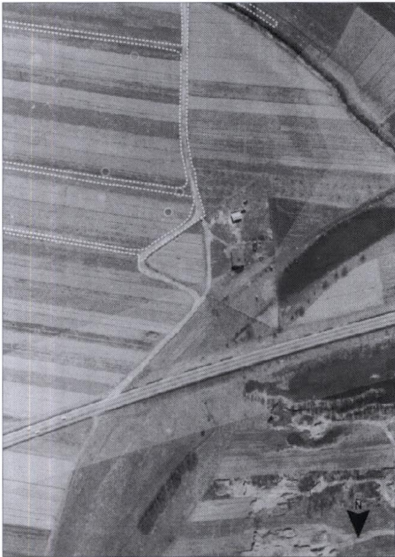
Informacijski sustav prostornog uređenja Prikazani slojevi: Ostale države (USGS), Digitalna ortofoto karta 1968., Granice na moru, Lokacijska dozvola, Gradovna čestica Mjerilo: 1:2000 Datum ispisa: 26.04.2025.