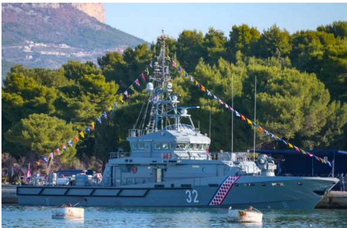
Slika 9 – Obalni ophodni brod „Umag“