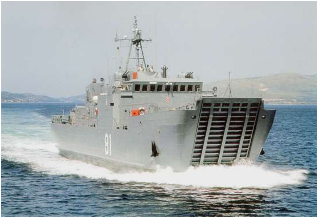
Slika 2 - Desantni brod "Cetina"

Najveći uspjeh BSO postigao je izgradnjom ratnih brodova, ponajprije triju klasa podmornica (B-71, B-72 i Una) i dvaju tipova ronilica (R-1 i R-2), čime se hrvatska brodogradnja svrstala uz bok najrazvijenijim zemljama svijeta. Osim toga, u BSO-u su izgrađena dva školska ratna broda duljine 97 m za iračku i indonezijsku ratnu mornaricu (1980.–1981.), tri višenamjenska vojna transportna broda duljine 58 m (Lubin, Ugor, Kit; 1982.–1984.) te tri mino polagača (Krk, Cetina, Krka; 1986., 1993., 1995.). Godine 2014. naručeno je pet obalnih ophodnih brodova za Ministarstvo obrane Republike Hrvatske, od kojih su isporučeni OOB-31 'Omiš' (2018.) i OOB-32 'Umag' (2025.).