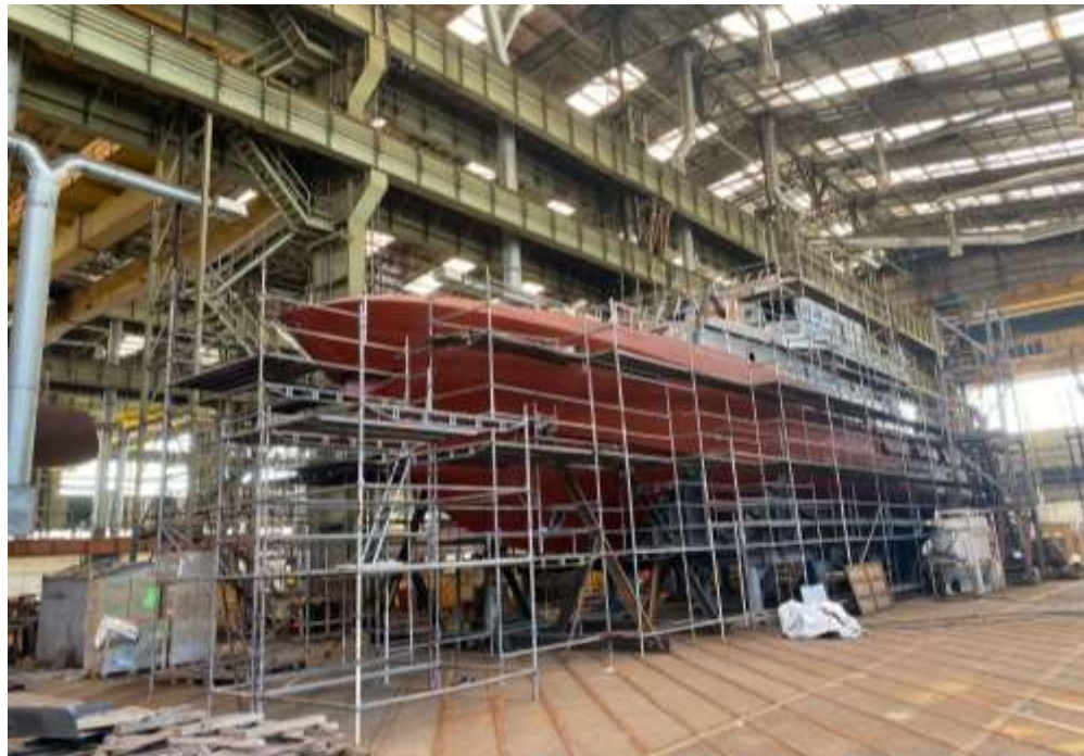
Slika 11 - Novogradnja 543 (Obalni ophodni brod)