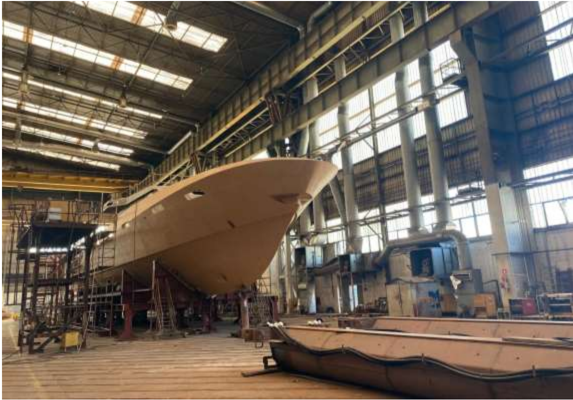
Slika 12 - Novogradnja 544 (Obalni ophodni brod)

Brodogradilište specijalnih objekata d.o.o. nositelj je ugovora o gradnji Obalnih ophodnih brodova od kojih su dva isporučena, a tri se nalaze u raznim višim stupnjevima gotovosti gradnje.