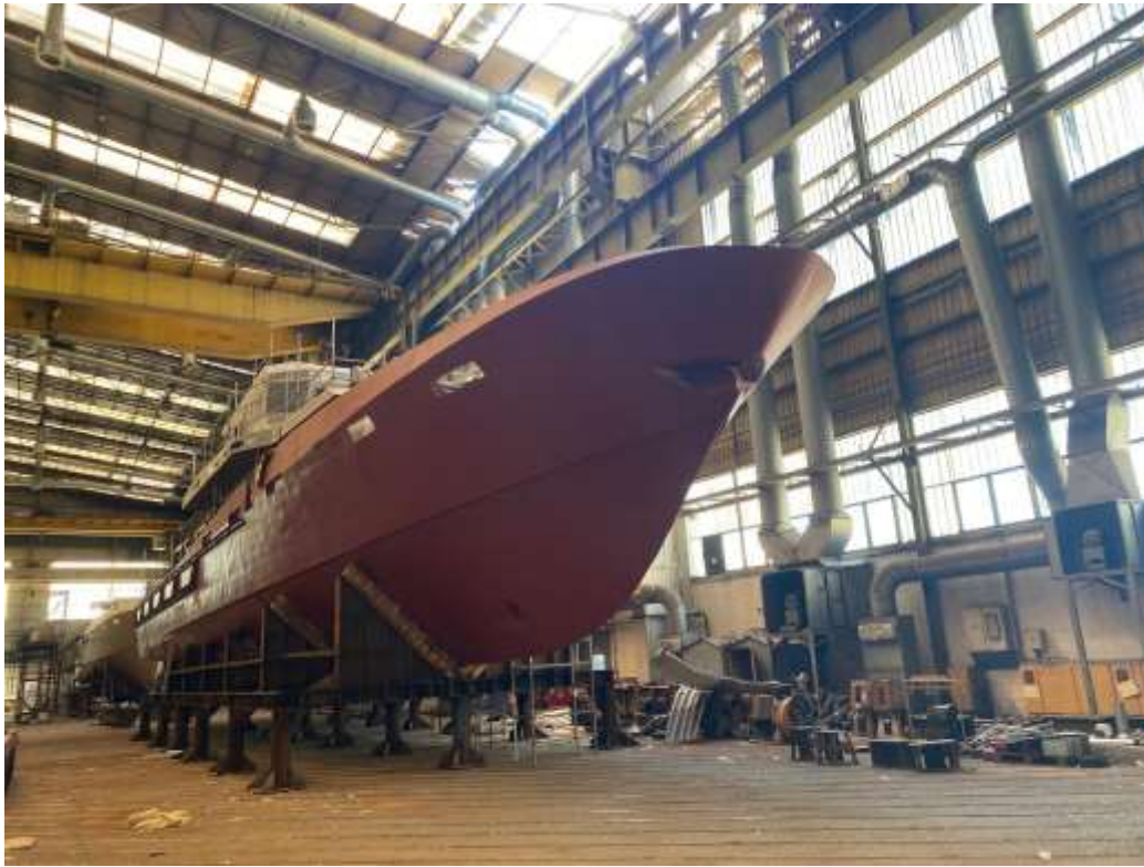
Slika 10 – Novogradnja 542 (Obalni ophodni brod)