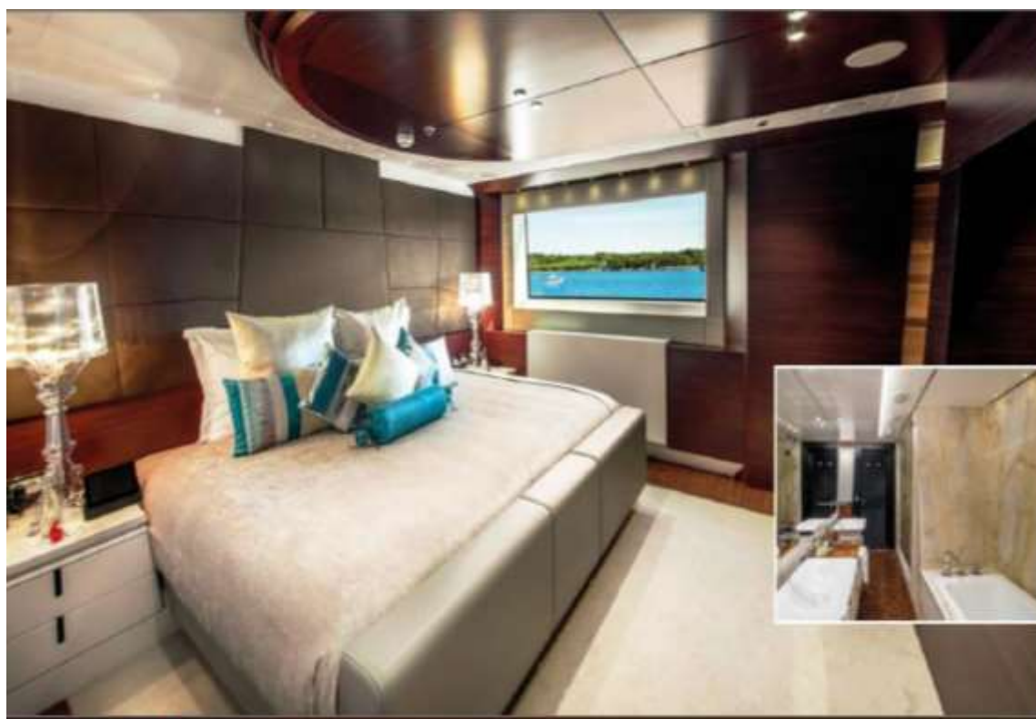
Slika 6 – detalj unutarnjeg uređenja jahte "Katina"