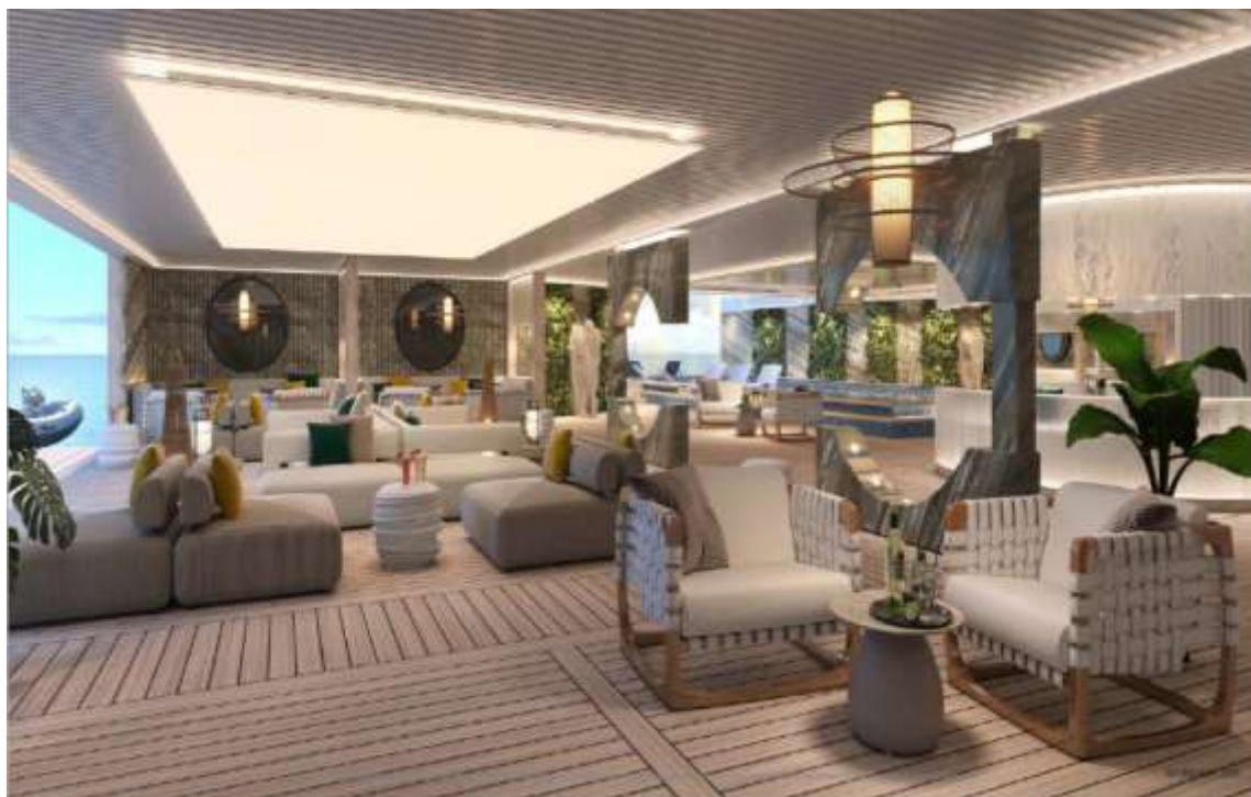
Slika 14 - Detalj uređenja rezidencijalnog kruzera

Izdavanje navedenog jamstva sukladno je članku 111. stavka 1. Zakona o proračunu („Narodne novine“, br. 144/21), i članku 53. Zakona o izvršavanju Državnog proračuna Republike Hrvatske za 2024. godinu („Narodne novine“, br. 149/23), te ne predstavlja državnu potporu. Instrumente osiguranja za ostatak do punog iznosa avansa osigurat će Brodogradilište specijalnih objekata d.o.o. kroz vlastite izvore odnosno uobičajene instrumente osiguranja kao što su mjenice, zadužnice, zalog na imovinu.