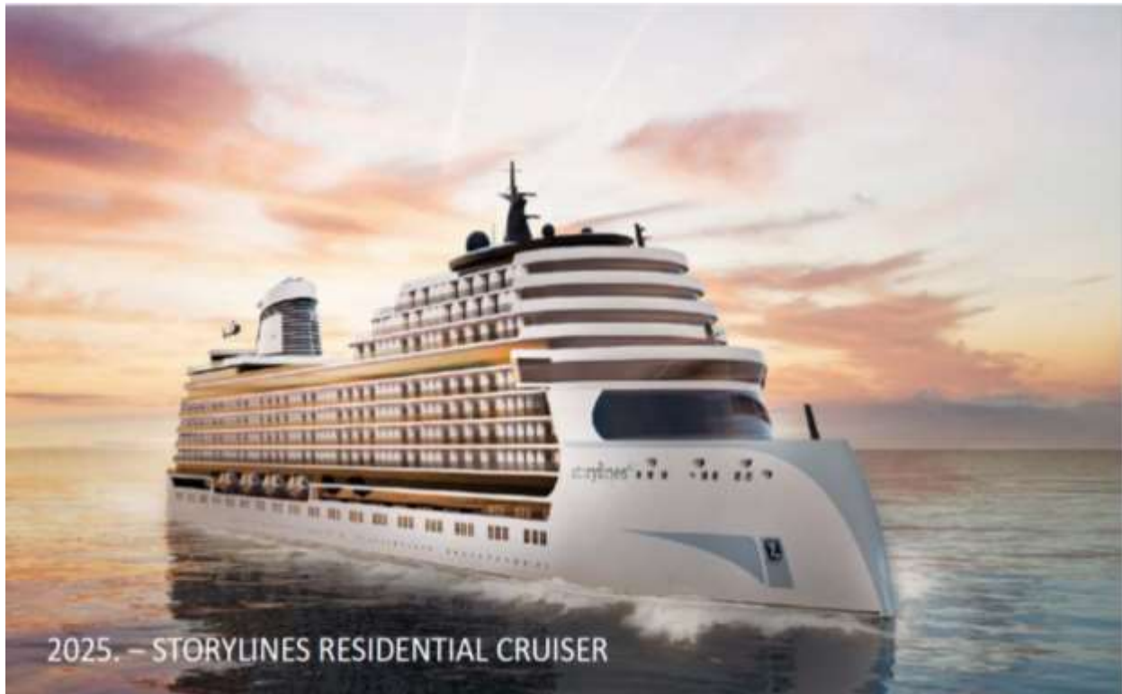
Slika 13 - Rezidencijalni kruzer

U brod će se ugraditi najnovija tehnološka dostignuća u području smanjenja emisija, sprječavanja onečišćenja, tretmana vode i energetske učinkovitosti, što će doprinijeti zelenoj tranziciji EU.