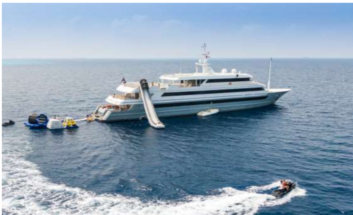
Slika 5 - jahta "Katina" (60m, 12 članova posade)