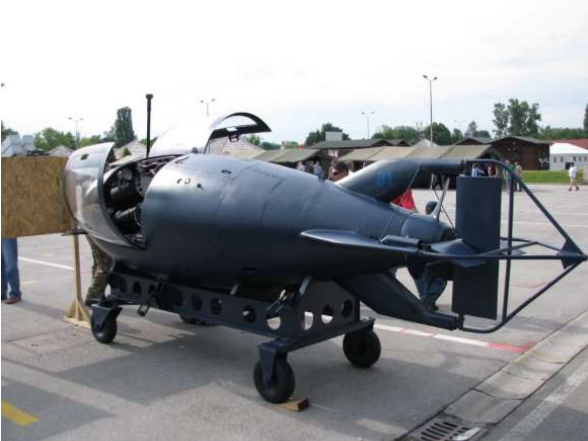
Slika 3 - Ronilica R-2M

za Jadroliniju, četiri broda za traganje i spašavanje duljine 17 m (1999.–2002.) i tri duljine 15 m (2004.–2005.) za Ministarstvo pomorstva, prometa i veza RH, istraživački brod Bios-2 (2009.) za Institut za oceanografiju i ribarstvo iz Splita, niz manjih putničkih brodova za krstarenja i dr. Od 2015. na navozima BSO-a gradi se luksuzna motorna jahta Katina duljine 60 m, a u novije vrijeme serija Obalnih ophodnih brodova za Hrvatsku ratnu mornaricu.