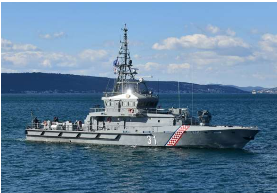
Slika 8 – Obalni ophodni brod „Omiš“