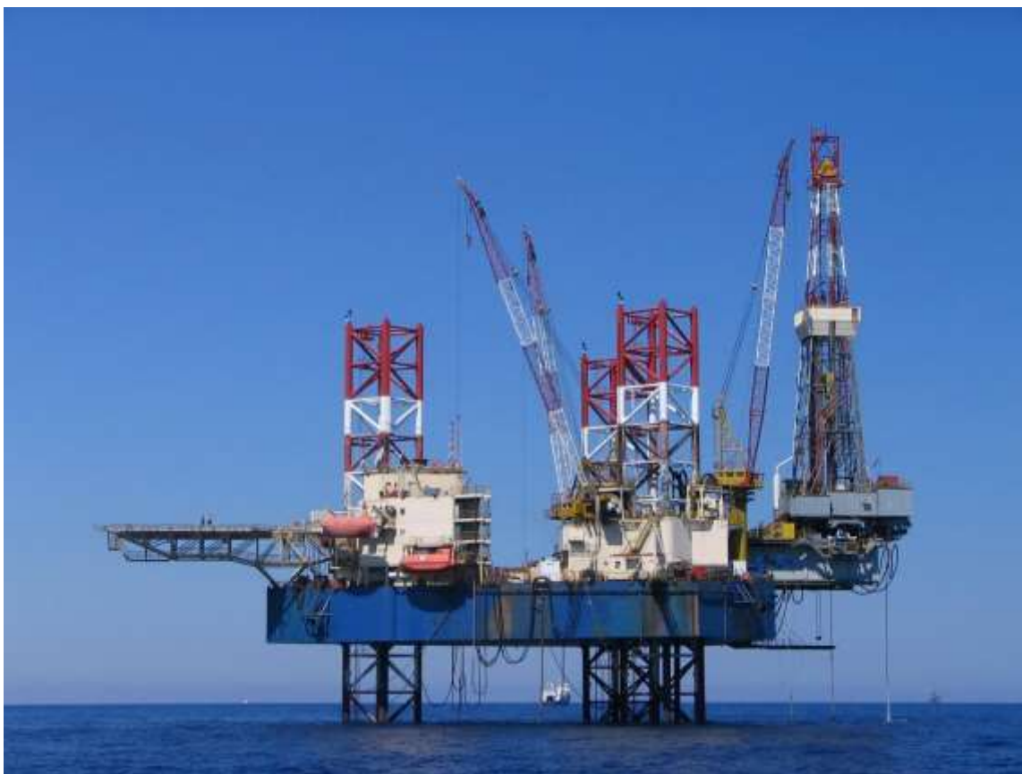
Slika 4 – Platforma za bušenje nafte i plina „Labin“ (produljenje nogu)

Društvo je kroz svoje djelovanje od osnutka specijalizirano za projekte i proizvode posebne namjene, poglavito vojne, istraživačke i radne namjene, odnosno brodova do 60 metara duljine obzirom na raspolaganje zatvorenim navozom tog kapaciteta. U novije vrijeme specijaliziralo se i za izgradnju jahti i brodova za kružna putovanja.