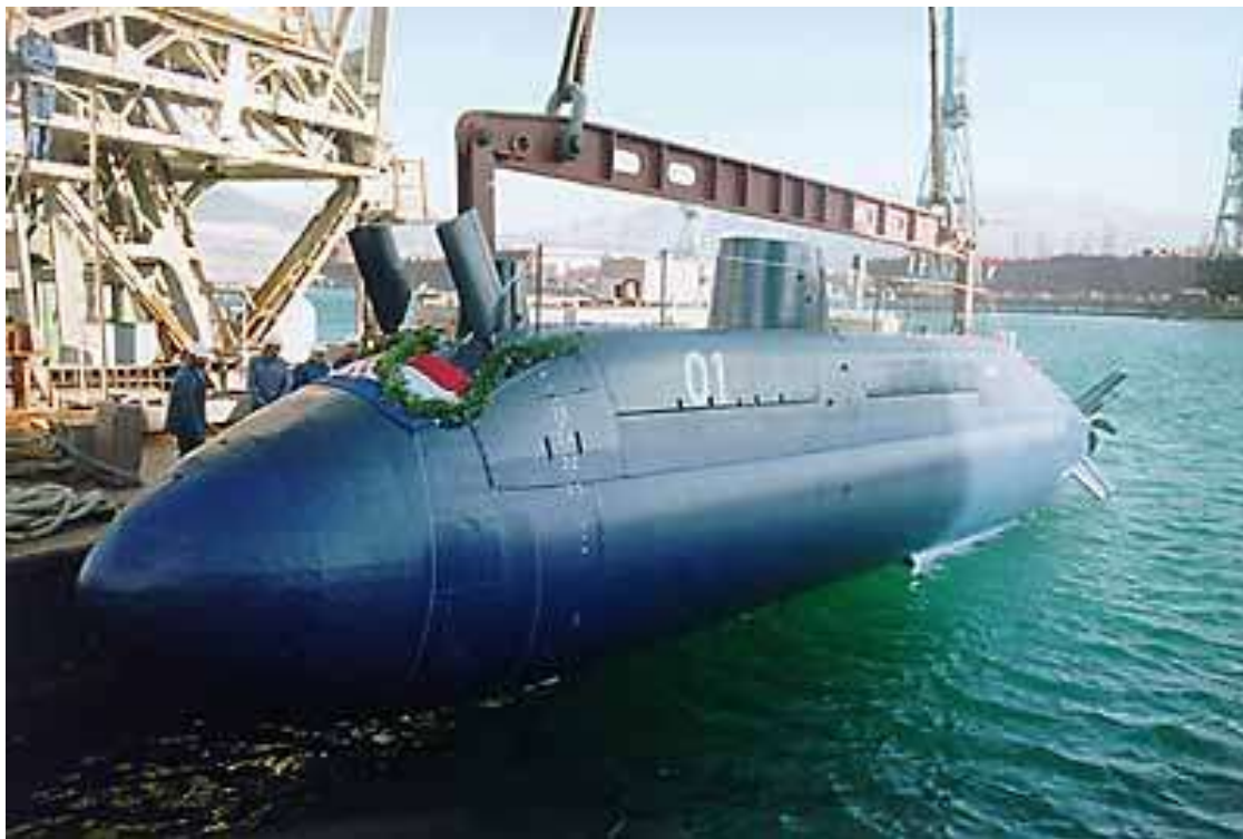
Slika 1 - podmornica "Velebit"

Osposobljeno je i za remont, popravak i održavanje specijalnih plovila. Šest desetljeća iskustva u gradnji sofisticiranih vojnih brodova, podmornica i specijalnih vojnih plovila osiguravaju mu značajno mjesto među brodogradilištima u Hrvatskoj, ali i među svjetskim brodogradilištima specijaliziranim za slične poslove. Iskusni tim stručnjaka odgovara na svaki zahtjev za unaprjeđenje i modernizaciju postojećih, kao i za razvoj novih projekata.