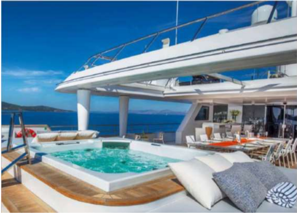
Slika 7 - Detalj vanjskog uređenja jahte "Katina"