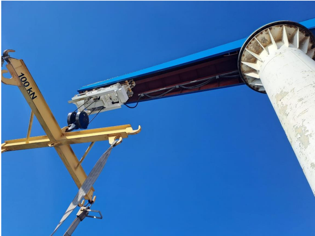
Slika 3 – Pogled odozdo