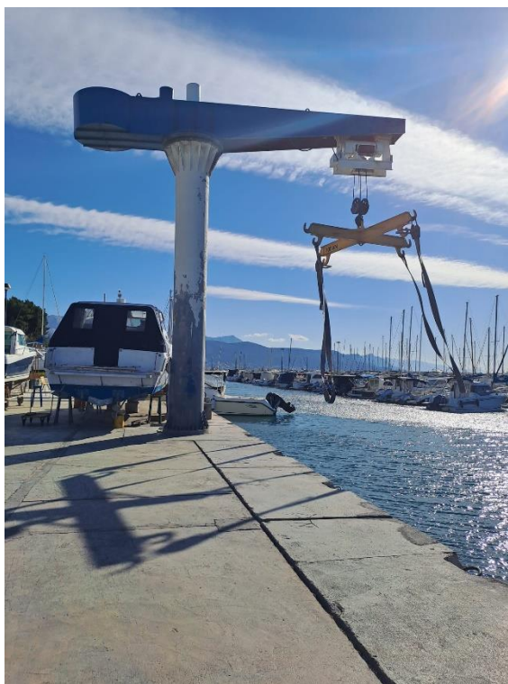
Slika 1 – Pogled na dizalicu sa zapada

Očevid je obavljen dana 16. Ožujka 2023. godine u Splitu Lučica Zenta , utvrdili smo da je dizalica oprativna i radi prema potrebama korisnika , te je pregledana redovito. Knjiga dizalice , postoji i redoviti pregled se radi. U privitku je kopija periodičkog atesta iz 2018 koje je vrijedio još tri godine. Dokumente vezane za dizalicu dobili smo od g. Ante Bradarić-Šljujo Lučka uprava SDŽ administracija Luka Zenta