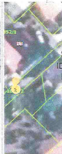
Slika 5 ID ZKC 842897 K. o. Maksimir

Status podatka PREUZETO OD PU Cjenovni blok DOTRŠČINA Pretežita namjena cjenovnog bloka S - STAMBENA NAMJENA