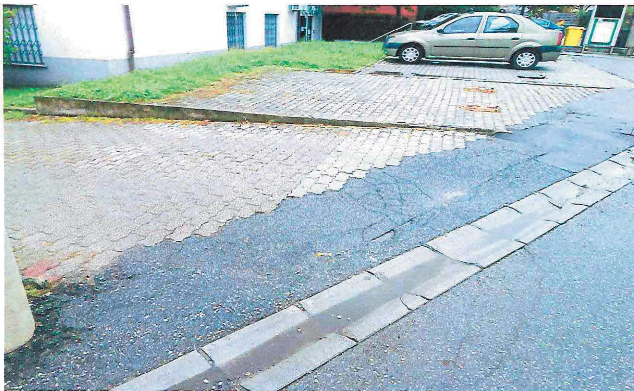
Slika 3 Pogled s pločnika prema jugozapadu. Pristup služnosti je neuredan s lošom izvedbom interventnog asfaltnog zastora na pločniku.

Adresa (lokacija) nekretnine: Kosa ulica 2e i 2d, Bukovac 10 000 Zagreb