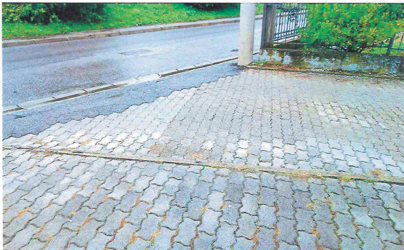
Slika 2 Slika k. č. br. 382. Površina cjelokupne čestice je u naravi kolno-pješački pristup za k. č. br. 380 tj. kućni broj 2D. Ploha sadrži bet. galanteriju.