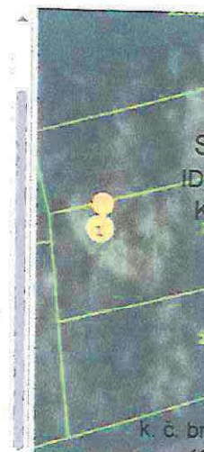
Slika 3 ID ZKC 951701 K. o. Remete

Adresa (lokacija) nekretnine: Kosa ulica 2d, Bukovac 10 000 Zagreb