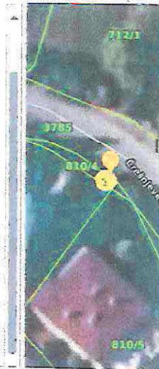
Slika 8 ID ZKC 2108575 K. o. Remete

ID ZKC 2108575 Datum pregleda 15.6.2024. Vrsta nekretnine GRAĐEVINSKO ZEMLJIŠTE (GZ) ID PN (PU) 5127670 Vrsta ugovora KP - KUPOPRODAJA Datum prvog evidentiranja ugovora u ZKC-u Površina u prometu 762,00 Vrijednost nekretnine (KN) 15.000,00 Vrijednost nekretnine (EUR) 1.990,84 Datum ugovora 09.09.2022 POREZI: NAPOMENA: za kupoprodaje svih vrsta zemljišta u iskazanoj cijeni prikazana je vrijednost nekretnine bez PDV-a, neovisno o tome podliježe li promet njegovoj naplati. Promet podliježe plaćanju PDV-a Stopa PDV-a (%) NE PDV uključen u prikazanoj cijeni 25 Optiranje NE Status podatka PREUZETO OD PU Cjenovni blok GRAČANI - REMETE Pretežita namjena cjenovnog bloka S - STAMBENA NAMJENA