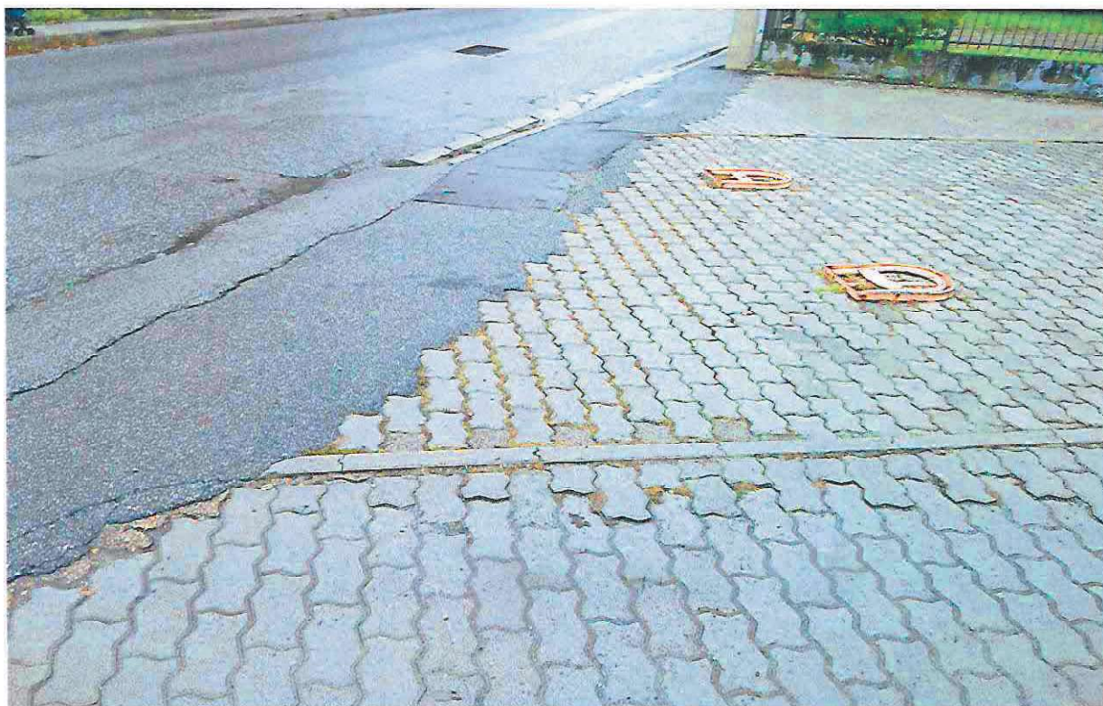
Slika 4 Slika k. č. br. 381/22. Površina cjelokupne čestice je u naravi kolni pristup vozila (parking) za k. č. br. 381/1 tj. kućni broj 2E. Ploha sadrži tlakavce.