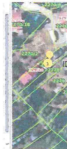
Slika 2 ID ZKC 500910 K. o. Remete