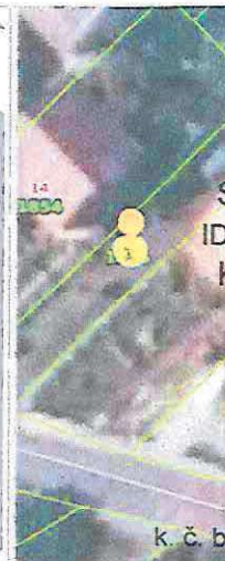
Slika 6 ID ZKC 260394 K. o. Maksimir

Status podatka PREUZETO OD PU Cjenovni blok DOTRŠČINA Pretežita namjena cjenovnog bloka S - STAMBENA NAMJENA