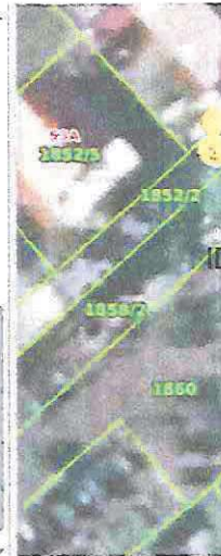
Slika 4 ID ZKC 263124 K. o. Maksimir

Status podatka PREUZETO OD PU Cjenovni blok DOTRŠČINA Pretežita namjena cjenovnog bloka S - STAMBENA NAMJENA