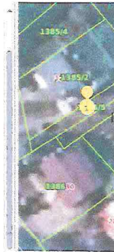
Slika 7 ID ZKC 903545 K. o. Remete

ID ZKC 903545 Datum pregleda 15.6.2024. Vrsta nekretnine GRAĐEVINSKO ZEMLJIŠTE (GZ) ID PN (PU) 3330976 Vrsta ugovora KP - KUPOPRODAJA Datum prvog evidentiranja ugovora u ZKC-u Površina u prometu 179,83 Vrijednost nekretnine (KN) 10.000,00 Vrijednost nekretnine (EUR) 1.305,15 Datum ugovora 29.12.2014 POREZI: NAPOMENA: za kupoprodaje svih vrsta zemljišta u iskazanoj cijeni prikazana je vrijednost nekretnine bez PDV-a, neovisno o tome podliježe li promet njegovoj naplati. Promet podliježe plaćanju PDV-a Stopa PDV-a (%) 25 PDV uključen u prikazanoj cijeni Optiranje Status podatka PREUZETO OD PU Cjenovni blok GRAČANI - REMETE Pretežita namjena cjenovnog bloka S - STAMBENA NAMJENA