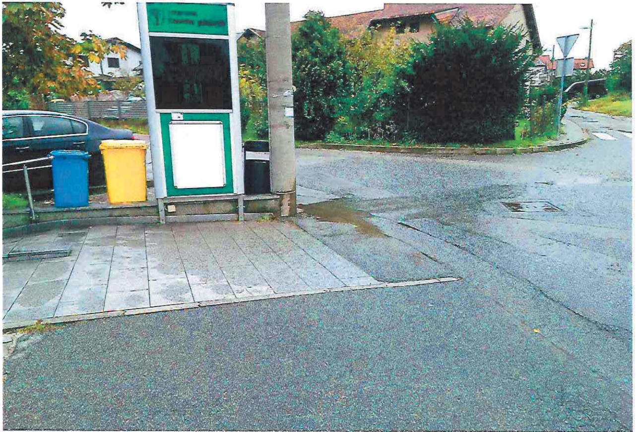
Slika 1 Pogled s k. č. br. 381/1 na promatranu malu k. č. br. 381/3. Cjelokupna čestica je popločena kamenim pločama kao nogostup u 100 % površine.