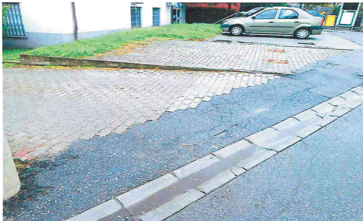
Slika 4 Odjeljenost k. č. br. 381/2 od k. č. br. 382 se vidi u betonskom parapetu koji odvaja voznu od parkirne zone.