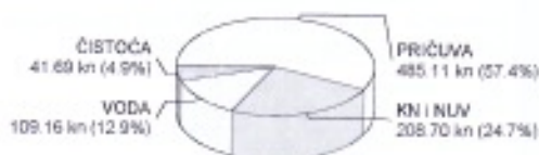
*Udio u cjelokupnom iznosu mjesečnog računa

PRIČUVA: 485,11 kn KOMUNALNA NAKNADA I NAKNADA ZA UREĐENJE VODA: 208,70 kn VODA: 109,16 kn ČISTOĆA: 41,69 kn SVEUKUPNO: 844,66 kn