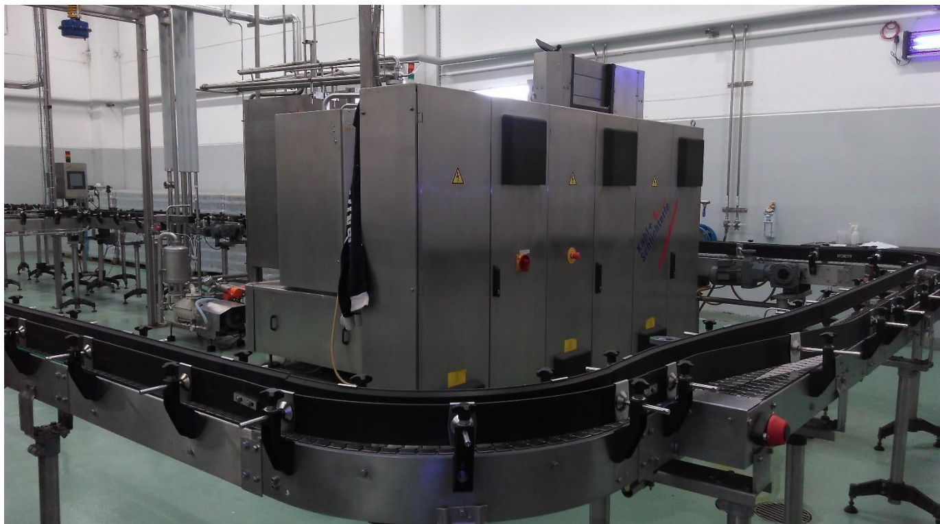
8.ENO.ME.CO SIRIO 7-IB_121