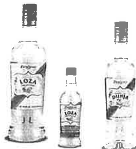
prilog: rakija Loza 1.00 i 0,10 lit, rakija Dunja 0,70 lit.

Proširen je asortiman jakih alkoholnih pića. Proizvedene su dvije nove voćne rakije Loza i Dunja , a njihova distribucija je započela u ožujku.