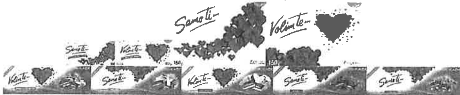
Prilog: asortiman Valentinovo

U prvom kvartalu 2016. godine lansirali smo nove proizvode. U drugoj polovici siječnja lansiran je asortiman Valentinovo koji je uključivao čokolade i bombonijere Samo ti i Volim te .