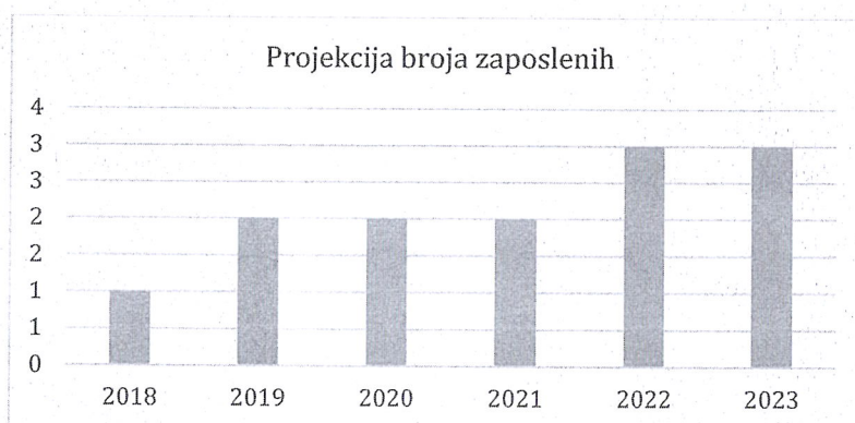
Grafički prikaz: Plan kretanja broja zaposlenih po godinama

Planirano kretanje broja zaposlenih prikazano je grafičkim prikazom u nastavku, a odnosi se na period od 2018. g. - 2023. g. Grafički prikaz prikazuje povećanje broja zaposlenih u odnosu na prethodne godine (prosječan broj zaposlenih) što je rezultat restrukturiranja tvrtke i povećanja prodaje do kojeg je došlo kroz projekciju budućeg poslovanja tvrtke.