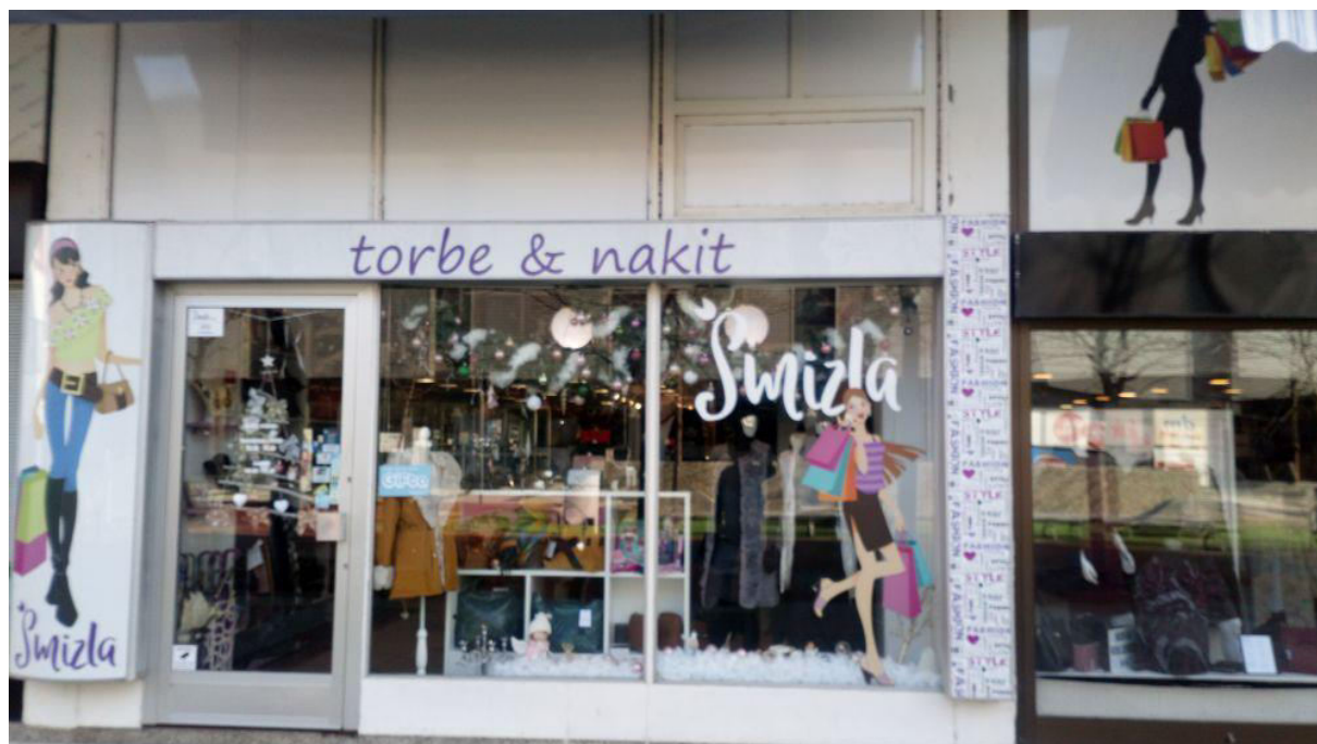
Slika 2. Trg slobode 4, Osijek- sjedište dužnika

Zakonskog zastupnika predmetnog dužnika kontaktiran je telefonski i obaviješten o postupku u tijeku. Adresa sjedišta predmetnog dužnika, Trg slobode 4, Osijek je fizički pohodena i prikazana na slici 2. Na navedenoj adresi se nalazi drugo društvo, te nema nikakvih tragova poslovanja prijašnjeg društva, što je potvrđeno od radnice u fotografiranom društvu.