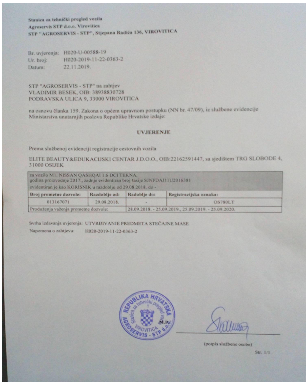
Slika 3. Uvjerenje STPV

Od stanice za tehnički pregled vozila zatraženo je uvjerenje o vlasništvu vozila predmetnog dužnika koje je prikazano na slici 3. Iz uvjerenja je vidljivo kako je predmetni dužnik evidentiran kao korisnik vozila M1 Nissan Qashqai 1.6 DCI Tekna godine proizvodnje 2017. registracijskih oznaka OS780LT, broja prometne dozvole 013167071 i broja šasije SJNFDAJ11U2016381. O predmetnom vozilu obavještava naknadnim dopisom od 10.12.2019. Impuls leasing d.o.o. kao o vozilu u njihovom vlasništvu dano na korištenje predmetnom dužniku.