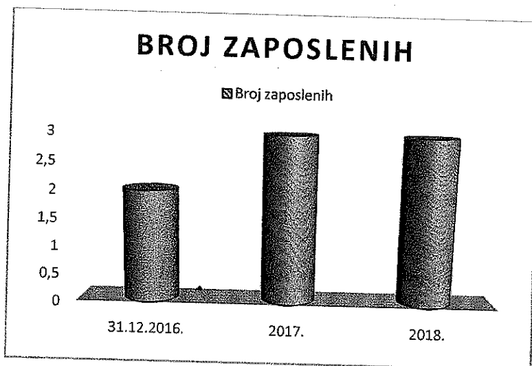
Grafički prikaz 1.: Struktura broja zaposlenih u naredne dvije godine poslovanja

U nastavku se nalazi grafički prikaz strukture broja zaposlenih do kraja tekuće godine te za naredne dvije godine poslovanja. Nakon mjera restrukturiranja, te otplate duga, sukladno rastu prometa, društvo planira otvoriti nova radna mjesta te zaposliti nove djelatnike.