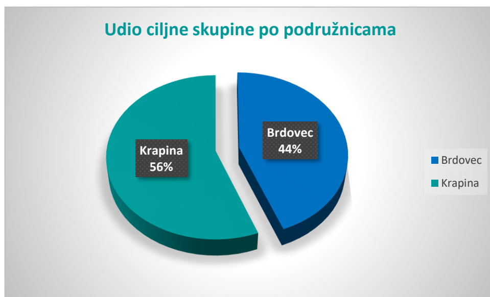
Slika 1. Udjeli ciljne skupine po lokacijama

Prema lokacijskoj analizi, moguće je vidjeti kako su primarni potrošači iz ciljne skupine - djeca roditelja koji imaju boravište na području grada Krapine i općine Brdovec. Vrtići su tako, lokacijski disperzirani, jer se grad Krapina nalazi u samom središtu Krapinsko – zagorske županije, dok je općina Brdovec dijelom Zagrebačke županije. Obje se lokacije smatraju ruralnim do izrazito ruralnim predjelima.